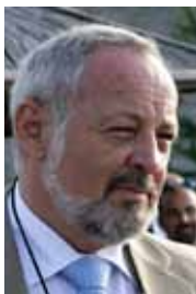
Eric Sottas Secretario General de la OMCT

Una consigna de una simplicidad infantil que numerosos Estados siguieron aplicando al pie de la letra este año