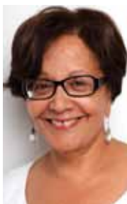
Souhayr Belhassen Presidenta de la FIDH

“Una sociedad auténtica, en la que la discusión y el debate constituyan una técnica esencial, es una sociedad llena de riesgos” 1 . Estas palabras del historiador Moses I. Finley sintetizan perfectamente el espíritu de este duodécimo Informe Anual del Observatorio. El informe documenta de manera precisa la situación de los defensores de derechos humanos en el mundo durante el 2009 y, con ello, pone claramente de manifiesto la dificultad y el peligro que entraña, en el mundo, promover el debate de ideas, el pluralismo, la protección de las libertades fundamentales y el ideal democrático.