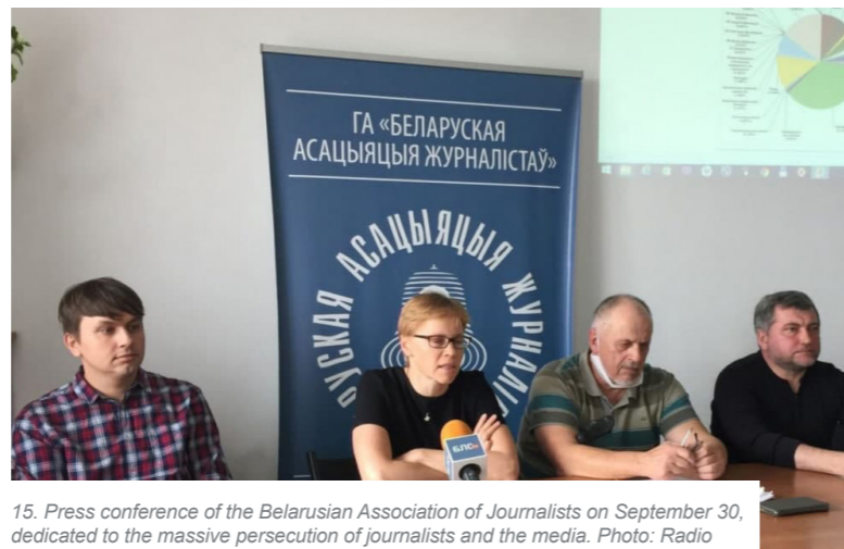
15. Press conference of the Belarusian Association of Journalists on September 30, dedicated to the massive persecution of journalists and the media.

Отдельно стоит отметить, что Министерство юстиции начало проверку в отношении Белорусской ассоциации журналистов.