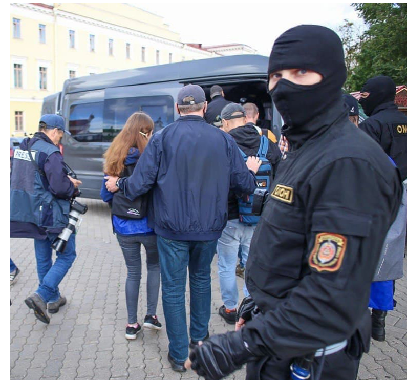
3. Массовое задержание журналистов в Минске 27 августа.