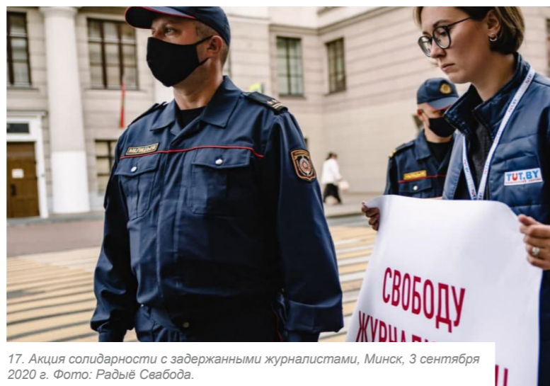
17. Акция солидарности с задержанными журналистами, Минск, 3 сентября 2020 г.

Преследование направлено на монополизацию государством распространяемого контента и ставит целью заставить замолчать независимые медиа, журналистов и блогеров. Если цели власти будут достигнуты, то для людей в Беларуси это может привести к замене объективной, достоверной и актуальной информации, которую распространяют независимые медиа, на государственную пропаганду.