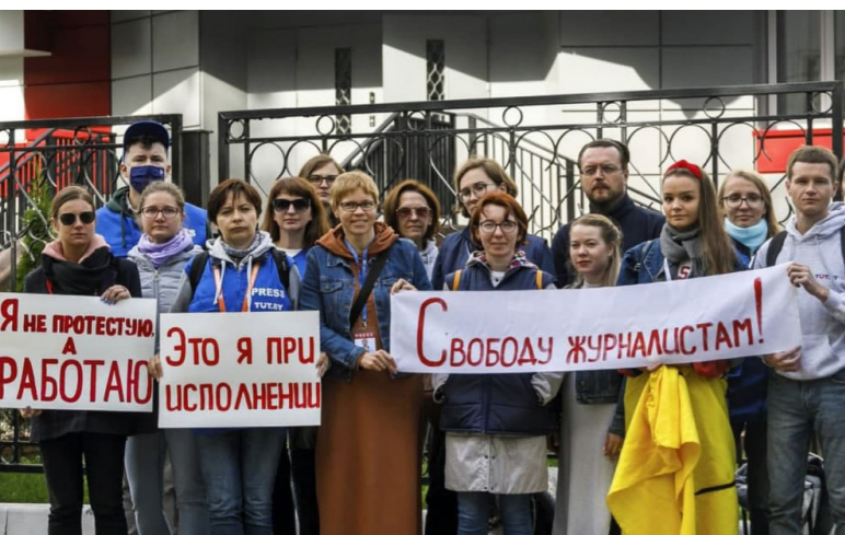
14. Митинг журналистов в поддержку задержанных коллег у Октябрьского РОВД Минска, 2 сентября 2020г.

Редакции СМИ получают предупреждения со стороны Министерства информации и органов прокуратуры: за распространение информации, которая признана государством экстремистской; за публикацию информации, которая может нанести вред «национальным интересам»; за распространение информации, «содержащей призыв к несанкционированным массовым мероприятиям» и др.