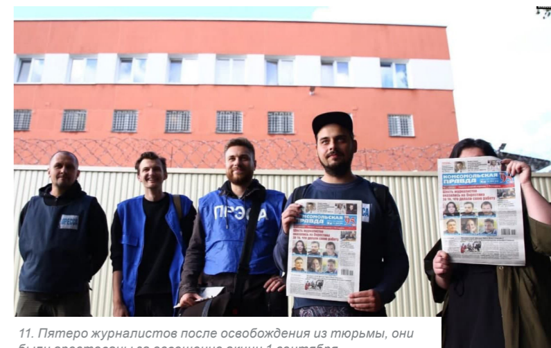
11. Пятеро журналистов после освобождения из тюрьмы, они были арестованы за освещение акции 1 сентября.

и национального процессуального законодательства, на основании противоречивых показаний свидетелей в масках с засекреченными данными наказали журналистов 17 тремя сутками ареста, тем самым оправдав их произвольное задержание и лишение свободы за профессиональную деятельность.