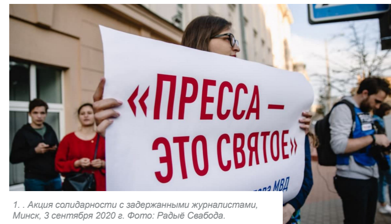
1. Акция солидарности с задержанными журналистами, Минск, 3 сентября 2020 г.

После окончания президентских выборов 9 августа 2020 года в Республике Беларусь, последовавших за ними массовых протестов и их подавления белорусские медиа столкнулись с жесткими репрессиями. Поствыборный период (с августа 2020 года по настоящее время) оказался для них самым тяжелым за все время существования независимой прессы в Беларуси. За реализацию свободы слова и права на получение и распространение информации в отношении журналистов и блогеров (которых власти приравнивали к организаторам протестов) массово применялись и продолжают применяться насилие, произвольные задержания, вызовы на допросы, обыски, осуждение по административным и уголовным делам, штрафы. Также были зафиксированы факты применения огнестрельного оружия.