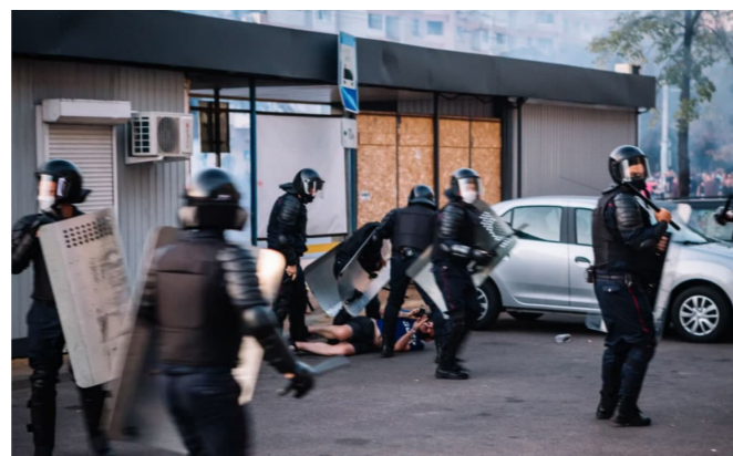
8. Задержание журналиста. Брест, 10 августа 2020 г.

Освещал события в городе Гродно 10 августа. Задержан сотрудниками ОМОН УВД Гродненского облисполкома (начальник Виктор Кравцевич, Viktor Krautsevich). Во время задержания избит: выбиты 4 зуба, гематома глаза, перелом кости на левой руке, многочисленные ссадины и ушибы. Журналист вспоминает: Был нанесен один удар ногой в лицо. Когда я упал, два человека начали меня избивать ногами и дубинками. Было нанесено порядка десяти ударов. Затем эти же два сотрудника занесли меня в автобус, где продолжили избивать ногами и дубинкой. В автобусе также нанесли около 10 ударов.