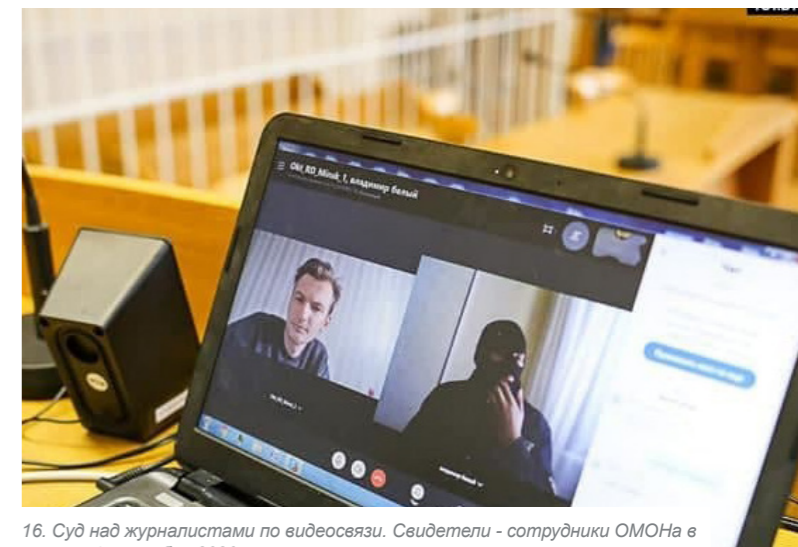
16. Суд над журналистами по видеосвязи. Свидетели - сотрудники ОМОНа в масках. 4 сентября 2020 г.

Закон запрещает СМИ освещать в режиме реального времени («стримы») массовые мероприятия, которые проводятся с нарушением установленного порядка их проведения — «в целях их популяризации или пропаганды». Также Закон предусматривает возможность приравнивания журналистов СМИ, освещающих массовые несанкционированные мероприятия, к их участникам. Установлен запрет публиковать в СМИ какую-либо информацию о планируемом массовом мероприятии до получения разрешения на его проведения со стороны государственных органов.